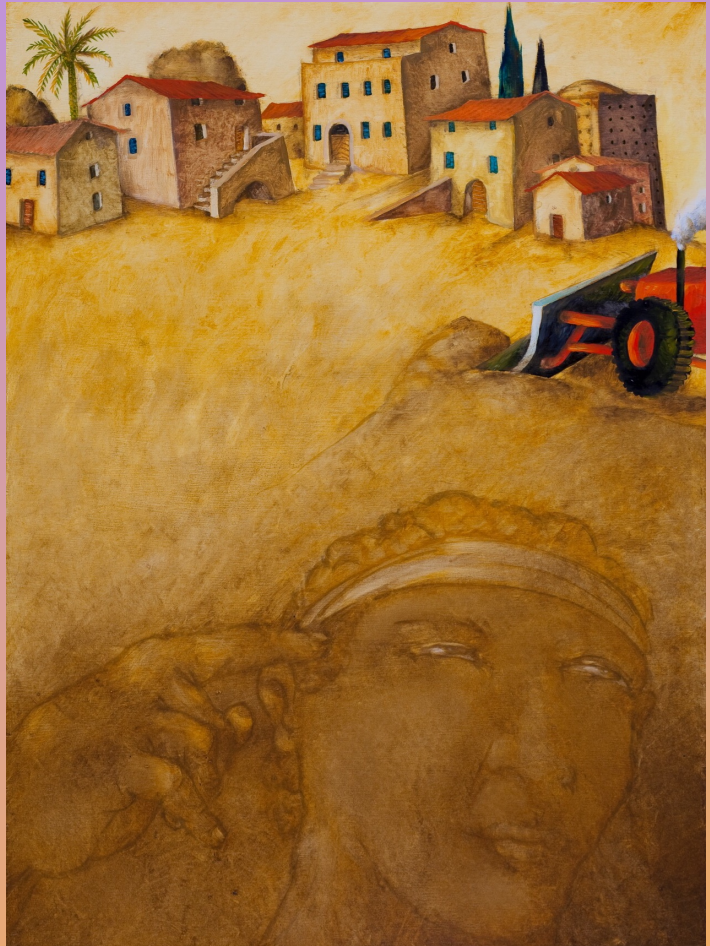
PEINTURE : TONI CASALONGA